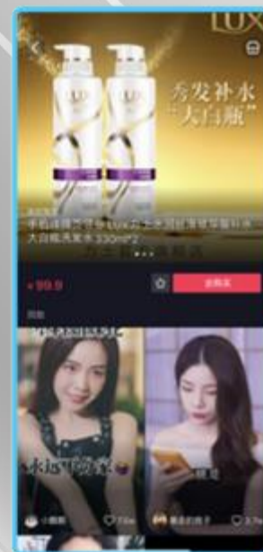
安然不是安然&力士洗髮水