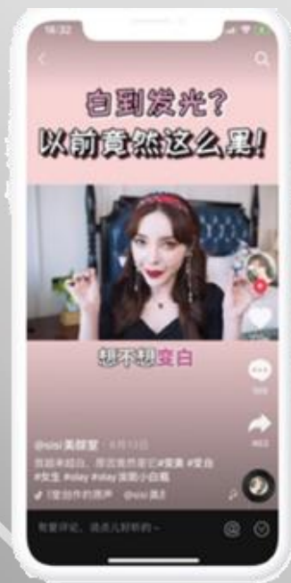
Sisi美顏室&oLay淡斑小白瓶