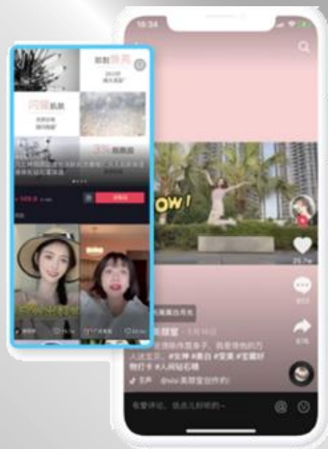
Sisi美顏室&凡士林身體乳